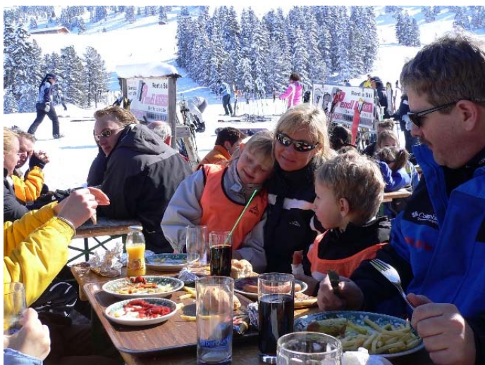
Uden mad og drikke...

I skrivende stund har vi ikke lagt os helt fast på hvor turen skal gå hen. Et er sikkert, vi finder et rigtig hyggeligt og børnevenligt sted, hvor vi alle har mulighed for at bo under samme tag, hvor børnene er velkomne og hvor de voksne kan hygge sig sammen om aftenen.