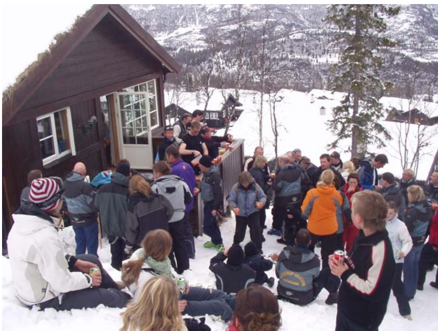
Hemse hygge på terrassen...

Også i år vil der være en ungdomshytte for de unge fra 15 år og op. Hvis du er