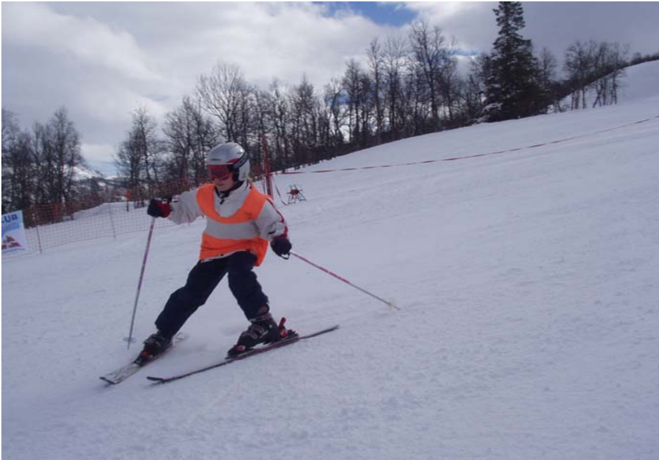
Hemsedal er super for børn...