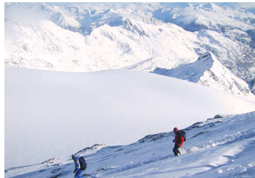
Altid super sne...