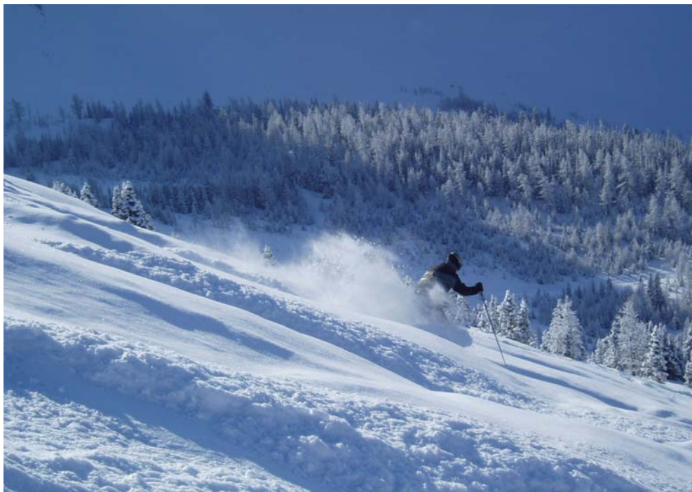
En fed dag på bjerget...