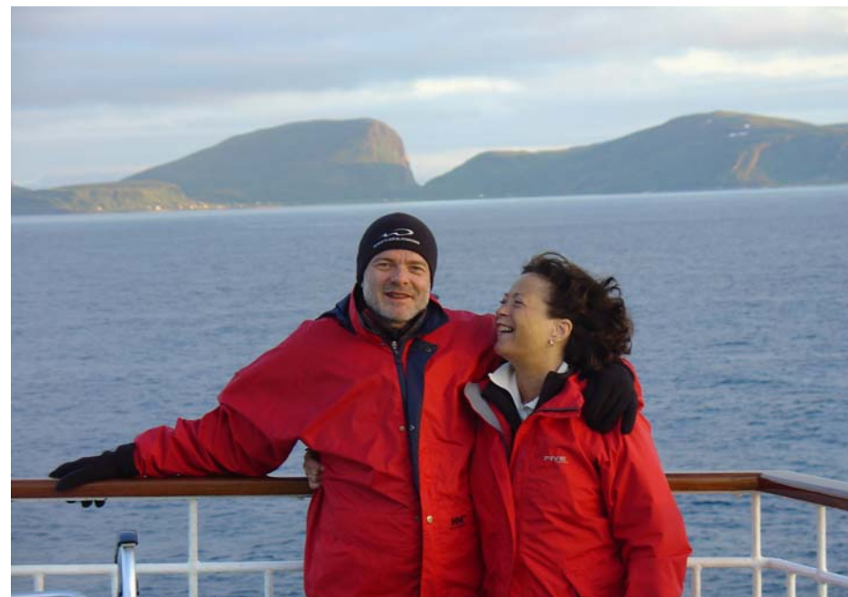
Sejltur i den smukke natur...

Da krydstogtskibene ikke sejler rundt om selve Nordkap, afmønstrede vi næste formiddag i Honningsvåg og fortsatte det sidste stykke i lejet bil. Naturen var nu mere rå, barsk og nærmest gold - ingen træer og ingen buske - men vi var jo også langt mod nord. For at komme de sidste 50 meter, måtte vi betale 190 kr. pr. person! Til fods bevægede vi os ud på Nordkapplateauet, som stiger ca. 300 ret op af havet. Vi befandt os nu på 71° 10' 21' nord for ækvator, ca. 2000 km fra Nordpolen og ca. 3000 km hjemmefra.