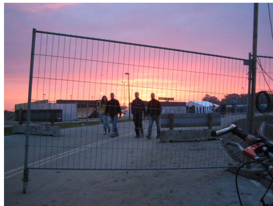
Roskilde by night...

Husk tilmelding til skiturene kan kun ske via www.glostrupskiklub.dk (har du ikke internet, må du ringe til en ven)