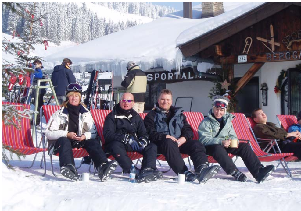
Og hygge i Saalbach...

nogle tilfælde være nødvendigt at køre med mindre hold – i tilsvarende kortere tid.